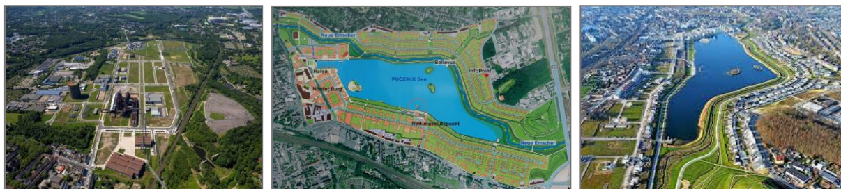
تصویر شماره ۴: پروژه Phoenix - دورتموند Figure 4: Phoenix Project - Dortmund

Phoenix See یکی از بزرگترین پروژه‌های توسعه شهری در آلمان است. در سال ۲۰۰۱، دوران جدیدی برای محدوده Hörde در دورتموند آغاز شد، ۱۶۰ سال تاریخ صنعتی با آغاز پروژه Phoenix به پایان رسید. در منطقه کوره انفجار سابق و سایت فولاد ThyssenKrupp منطقه تفریحی جدیدی شکل گرفت که به عنوان نمونه تحول اساسی در سائیتی با هویت صنعتی و تبدیل به محدوده تفریحی محسوب می‌گردد. دریاچه جدید همگان را برای پیاده‌روی، دوچرخه‌سواری و اسکیت دعوت می‌کند. ساحل این دریاچه را ساختمان‌های مسکونی مدرن، دفاتر تجاری و همچنین مجموعه‌های تفریحی با رستوران‌های متعدد تشکیل داده است.