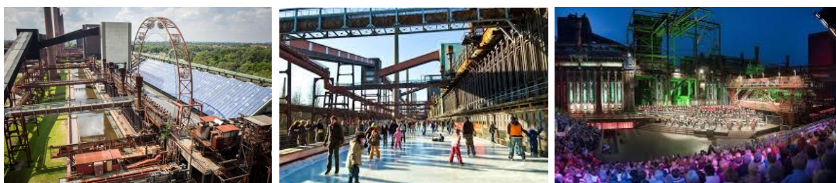
تصویر شماره ۵: مجموعه معدن زغال سنگ Zollverein - اِسِن Figure 5: Zollverein Coal Mine Industrial Complex-Essen

تخصیص برنامه‌های جدید در حاشیه محدوده، به ساختمان‌های قدیمی اجازه داد تا عظمت خود را حفظ کنند و بر بازدیدکننده تاثیرگذار باشند. برنامه‌ریزی ساختمان‌های جدید و برنامه‌ریزی مجدد ساختمان‌های موجود، عملکردهای بسیاری را شامل می‌شوند که بیشتر آنها مربوط به هنر و فرهنگ می‌باشند.