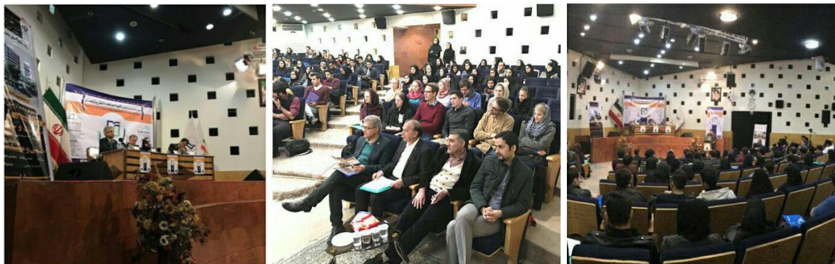
تصویر شماره ۲: سمینار "آتلیه دورتموند" - کتابخانه مرکزی اصفهان

این برنامه منجر به پایه‌ریزی عقد تفاهم نامه دانشگاه با اداره نوسازی و بهسازی شهرداری اصفهان بمنظور عملیاتی شدن دستاوردهای نهایی پروژه گردید.