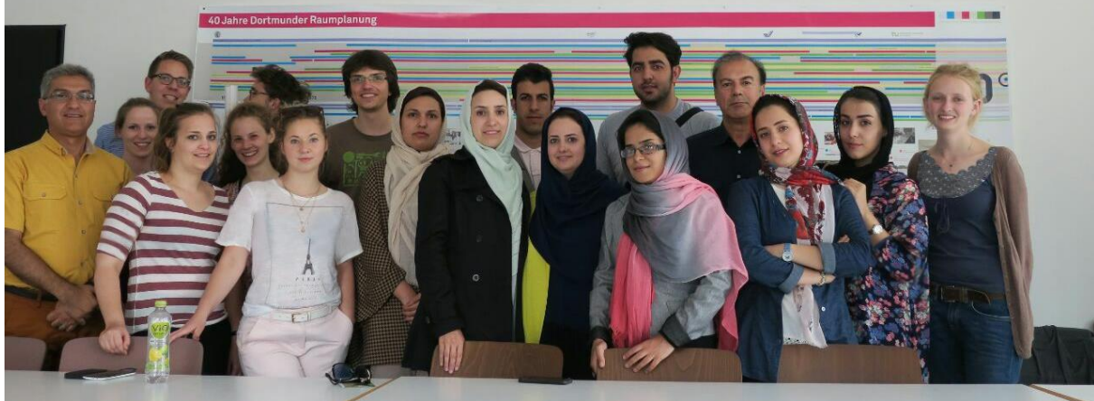
تصویر شماره ۳: پروژه مشترک - دانشگاه دورتموند